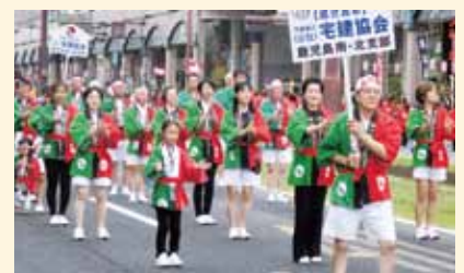
会長を先頭に女性、男性の順で続きます。子供はお父さんお母さんと一緒に踊ります。