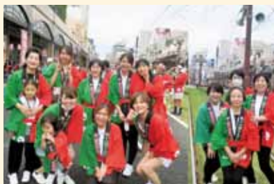
マルヤガーデンズから山形屋方面に向かって踊ります。