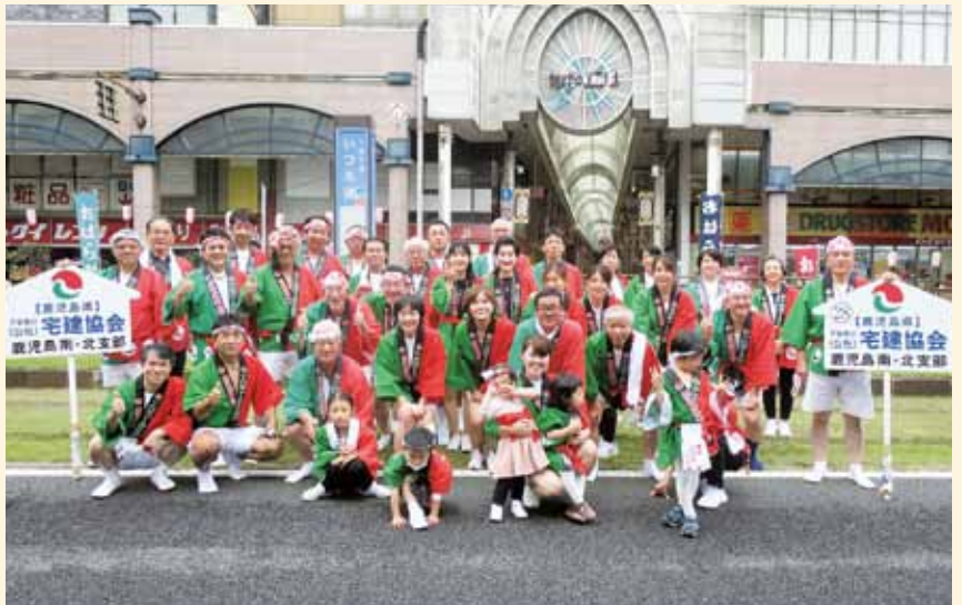
元気に楽しく全員が一つになっておはら祭りを盛り上げました。